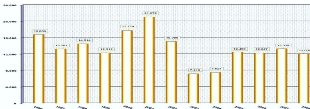
Διάγραμμα 3: Εξαγωγές ελληνικής κομπόστας ροδάκινου, 1996-2008, 000 Χ/Κ 24x1 Kg